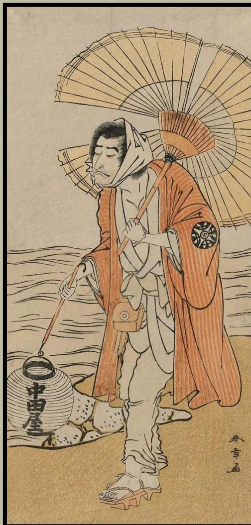
Nakamura Nakazo színész, Katsukawa Shunsho, 1779

Bár a buddhista szerzetesek gyakran viselnek köntöst, az ilyen ruhák nem praktikusak, amikor a templom körüli munkákat végzik. A templom körüli munkákat, mint például a favágás vagy a söprés, amelyek a szerzetesek vagy apácák gyakorlatának részét képezik, samu -nak nevezik, ezért a samue -t úgy alkották meg, hogy a samu végzése közben viseljék.