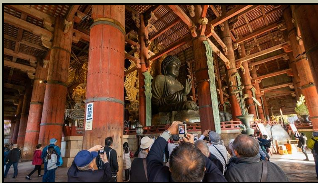
A Todaiji templom Nagy Buddhája

Az arannyal, ezüsttel és lakkozással díszített kardok a templom Shosoin raktárában őrzött Kokka Chimpo Cho (A Todaiji nemzeti kincseinek könyve) fegyverlistáján mintegy 100 kard között szerepelnek. Fontos történelmi anyagnak számítanak.