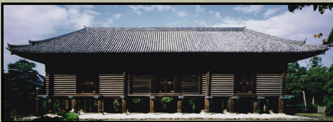
Shōsōin 正倉院: A nemzeti kincsek tárháza

A feljegyzések szerint összesen hét kincset vittek el a kincsesházból. Ebből a hétből a két kard az egyetlen, amelynek jelenlegi helyét és létezését megerősítették. A kutatás folytatódik, hogy kiderüljön, van-e más, megőrzés alatt álló műtárgy, amely kapcsolatban állhat az eltűnt kincsekkel.