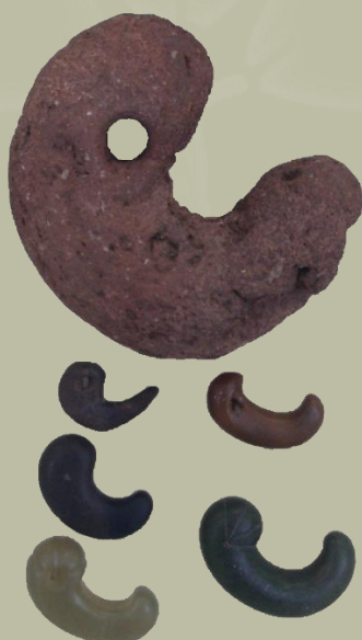
Magatama, a Jōmon-korszakból, ami a 8. századba datálható.

A „ magatama ” (勾玉, ritkábban 曲玉) egy ívelt alakú gyöngy, amely az őskori Japánban a késői Jōmon -korszaktól a Kofun -korszakig, nagyjából i. e. 1000-tól az i. sz. 6. századig volt jelen. Ezeket az „ékszereknek” is nevezett gyöngyöket kezdetben egyszerű kőből és földből készítették, de a Kofun -korszak végére már szinte kizárólag jádéből. A magatama eleinte díszítő funkcióval bírt, de a Kofun -korszak végére már szertartási és vallási tárgyként használták.