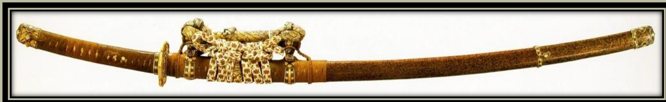
Itomaki-tachi-koshirae a Dōjigiri-Yasutsuna pengén