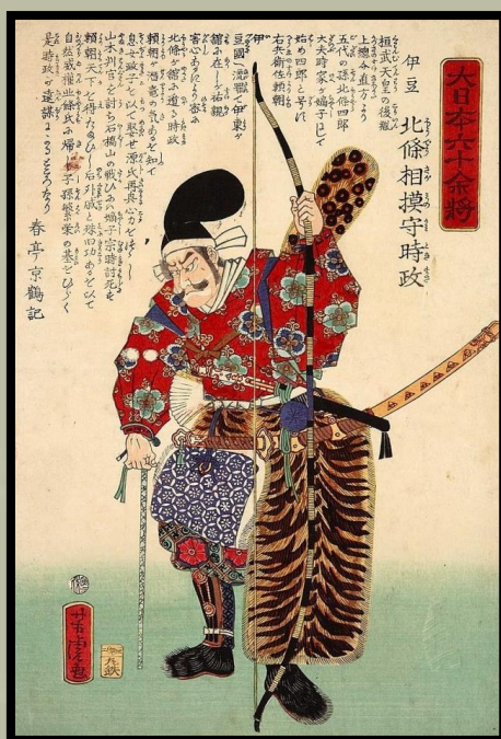
Egy ukiyo-e Hōjō Tokimasa-ról

Mivel a kis asztalt egy démon faragása átkozta meg, ez a kard képes volt elválni a fenyegtetést szellemi síkon is.