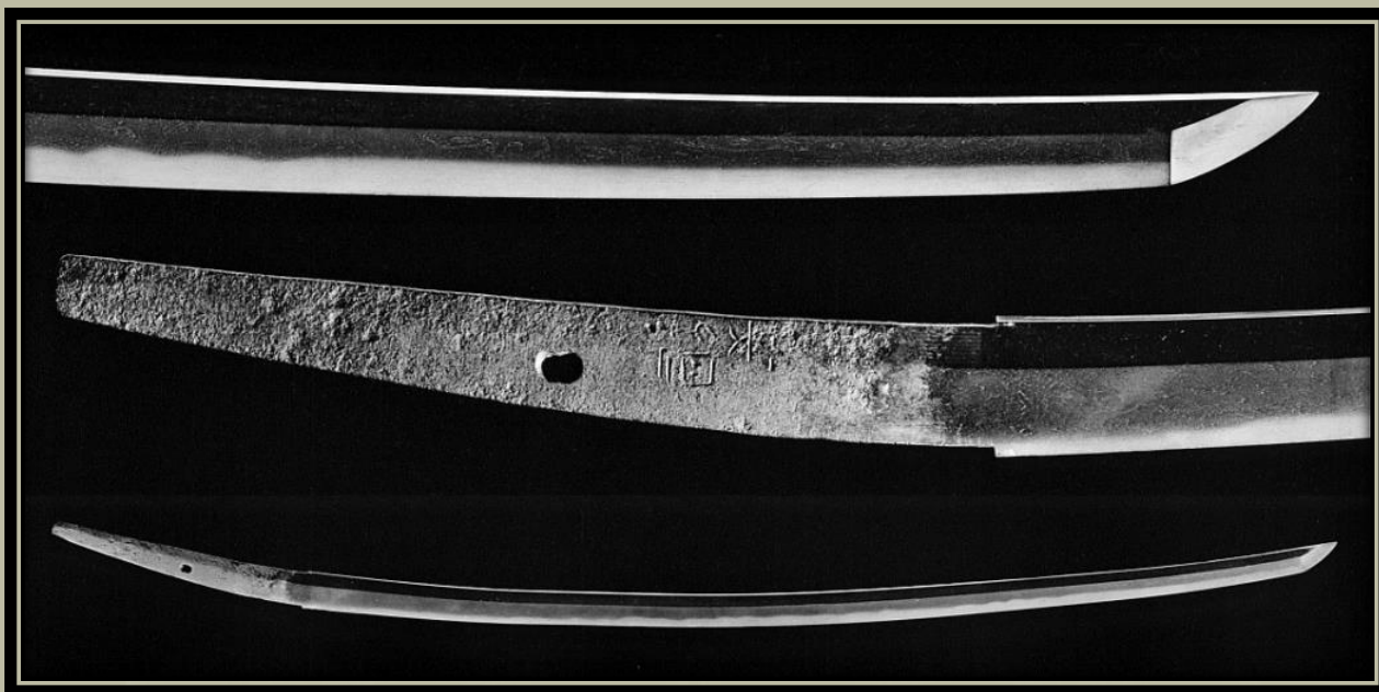
Kokuhō Dōjigiri-Yasutsuna, mei: "Yasutsuna", nagasa 80 cm, sori 2,7 cm, shinogi-zukuri, iori-mune, mély koshizori, funbari, ubu-nakago.

Úgy vélik, hogy a Heian -korszak egyik kardkészítője, Yasutsuna munkája. Azt mondják, hogy Minamoto no Yorimitsu , aki a Seiwa-Genji ( Minamoto klán) közvetlen leszármazottja, ezzel a karddal vágta le a Tanba tartományban lévő Oe -hegyen élő ördög, Shuten Doji fejét. A Dojigiri neve ebből a legendából származik. Ezen kívül számos anekdota is ismert a karddal kapcsolatban. Később az Ashikaga sógun családtól Toyotomi Hideyoshi , Tokunaga Ieyasu , Tokugawa Hidetada , Matsudaira Tadanao ( Hidetada egyik lányának férje), majd az Echizen tartománybeli Matsudaira család Takada tartományából Tsuyama tartományba került. A Tsuyama tartomány Matsudaira családja családi kincsként örököltette tovább a három híres kardot: Dojigiri , Inabago és Masamune Ishima .